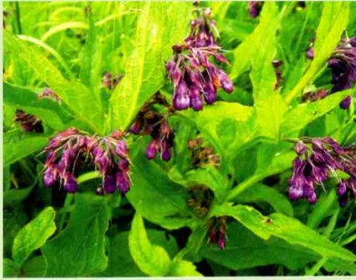
Beinwell (Symphytum officinale) ist besonders reich an Allantoin

ren pH-Wert aufweist. Wissenschaftlich bestätigt ist die seit langem bekannte wundheilungsfördernde und zellregenerierende Wirkung von Allantoin. Zusätzlich wird seine hornhauterweichende (keratoplastische) und hautglättende Wirkung in der Kosmetik vor allem in Produkten zum Einsatz gegen unreine Haut geschätzt. Neben diesen bekannten Eigenschaften wird in verschiedenen Publikationen auch berichtet, dass Hautirritationen gemildert werden können. Weiterhin ist eine, wenn auch nur mäßige, feuchtigkeitsspendende Wirkung feststellbar. Aufgrund seiner ausgesprochen guten Hautverträglichkeit bietet sich Allantoin besonders auch zur Anwendung bei entzündlicher und sensibler Haut an.