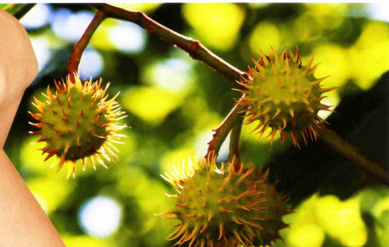
Roskastanienrinde enthält den Wirkstoff Allantoin